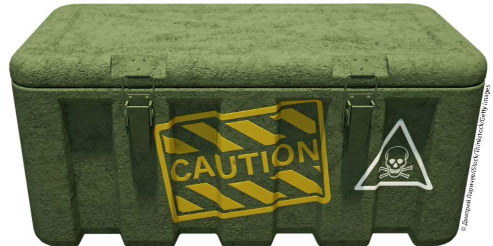
Vorsicht bei Gütern, die eigens für eine militärische Verwendung konstruiert wurden.