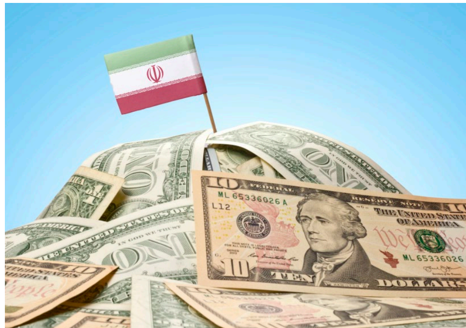
Bei US-Dollar-Geschäften sollte jeder Iran-Bezug vermieden werden – und umgekehrt.

Weil die Rohstoffe in US-Dollar bezahlt werden, sind US-Personen (nämlich US-