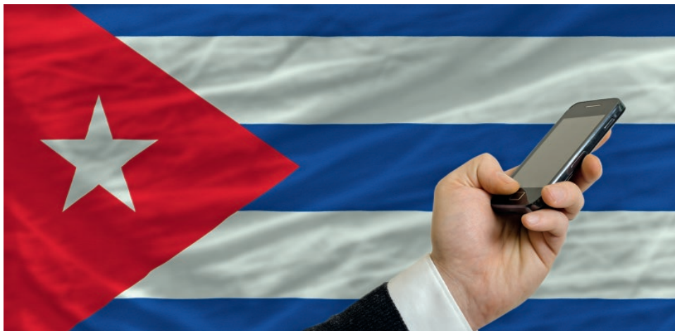
Mobiltelefone fallen in den Anwendungsbereich der Allgemeingenehmigung CCD.

Am 16. Januar 2015 verkündete US-Präsident Obama das mögliche baldige Ende des US-Kuba-Embargos. Vorläufig geht es aber nicht um eine völlige Abschaffung dieses US-Embargos, sondern erst einmal um eine Umwandlung in ein Teilembargo. Gibt es gegenwärtig bereits Erleichterungen, und wenn ja, in welchen Bereichen werden diese Erleichterungen wirksam? Auf welche Änderungen sollten sich die Exporteure einstellen?